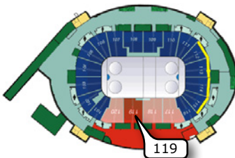
1. Ring = Kategorie 1

Die Hartwall Arena verfügt über 2 Ringe. Unsere Tickets befinden sich in Sektoren 119, 302 und 307.